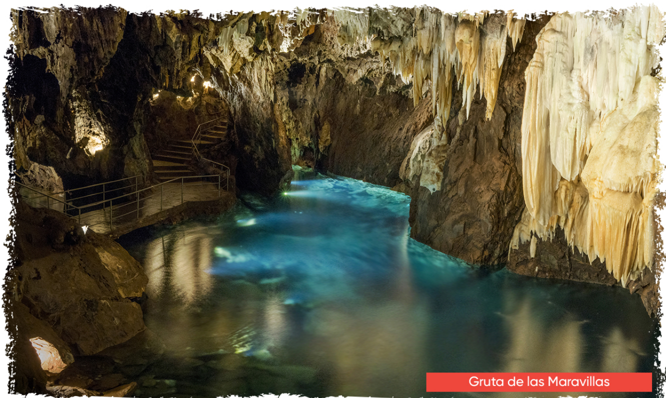
Gruta de las Maravillas