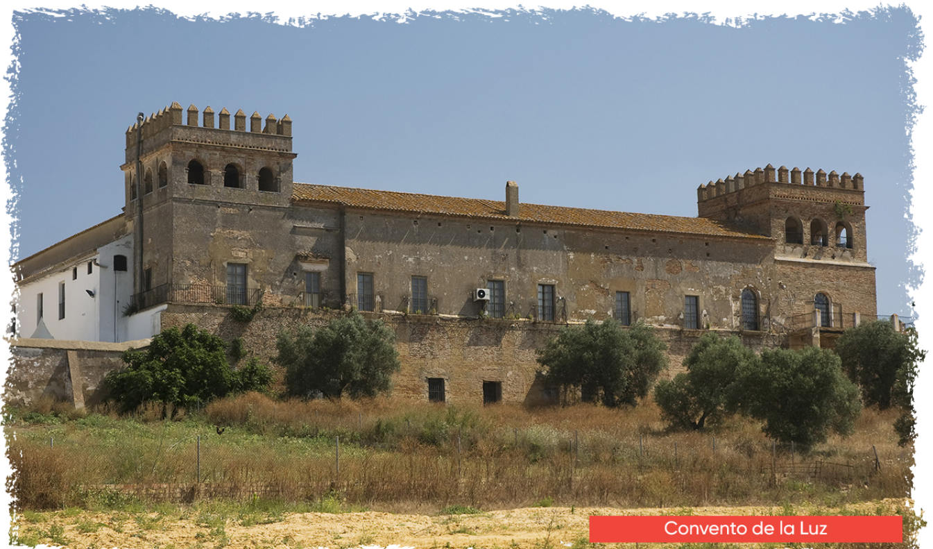
Convento de la Luz