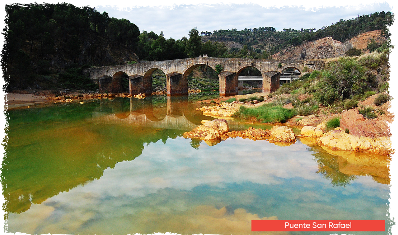
Puente San Rafael