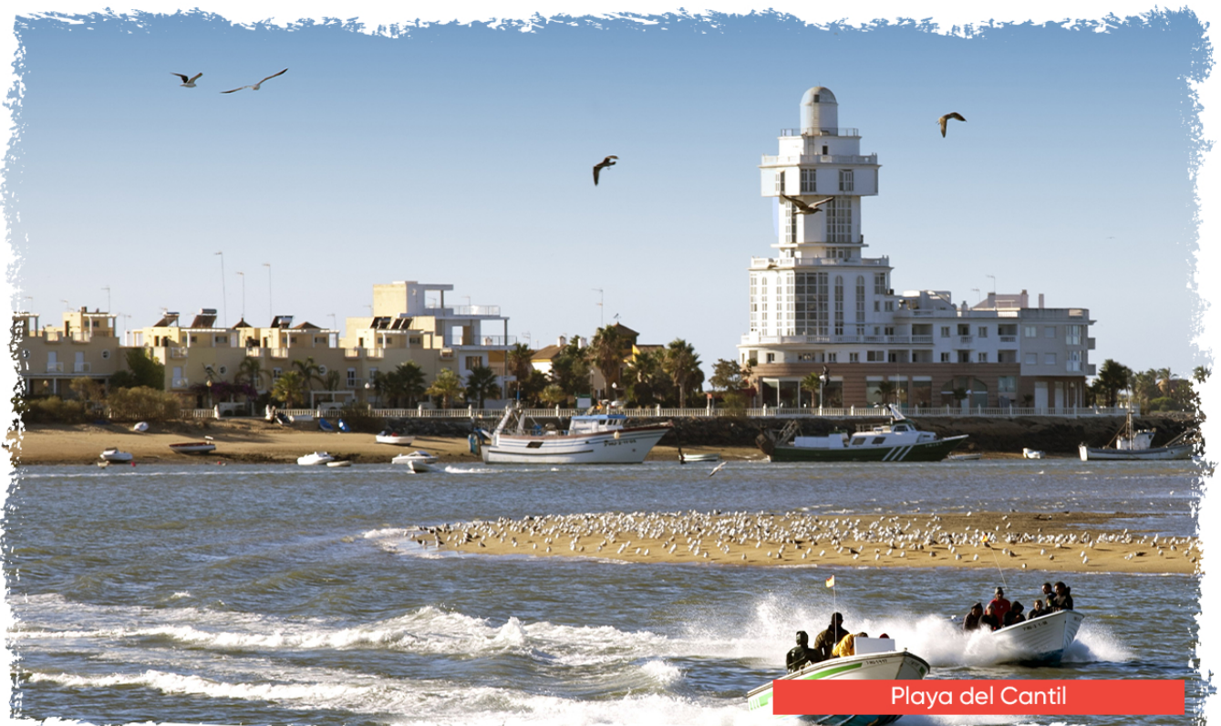
Playa del Cantil