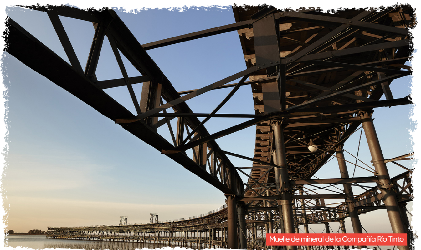
Muelle de mineral de la Compañía Río Tinto