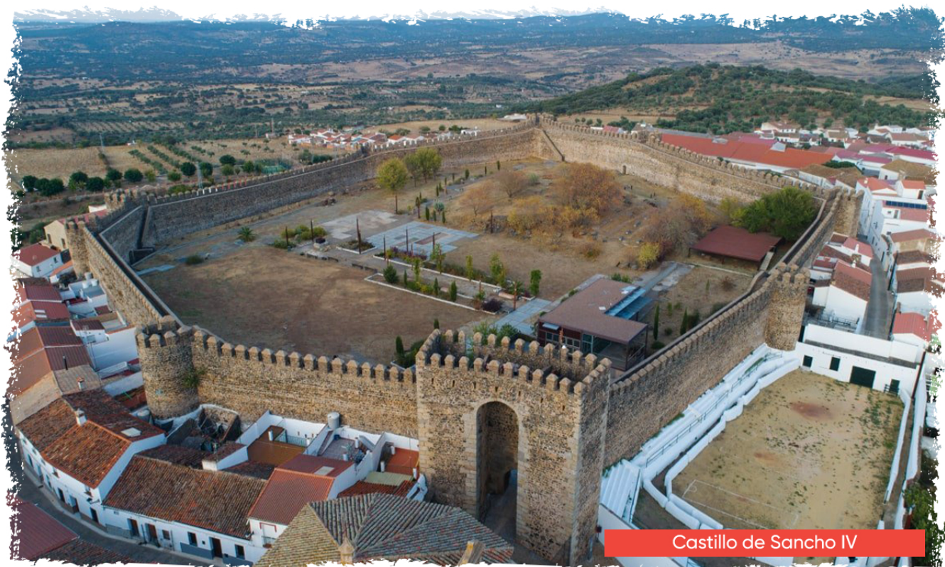
Castillo de Sancho IV