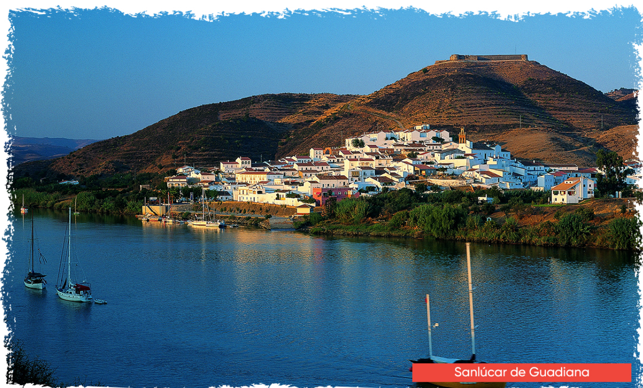
Sanlúcar de Gadiana