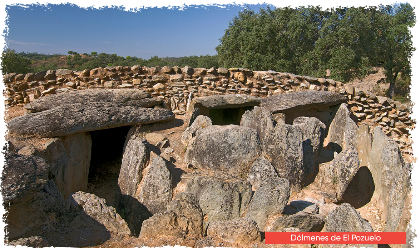
Dólmenes de El Pozuelo