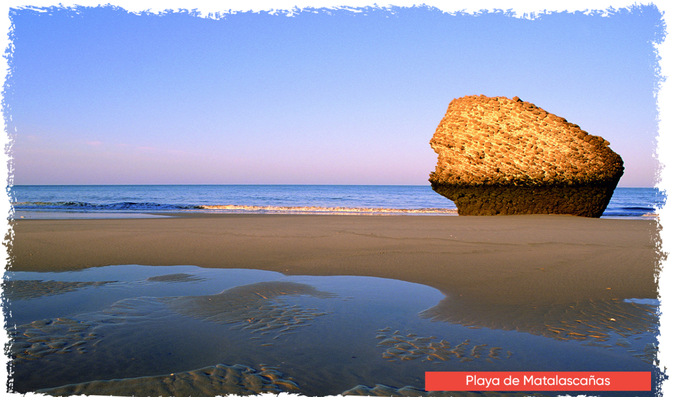
Playa de Matalascañas