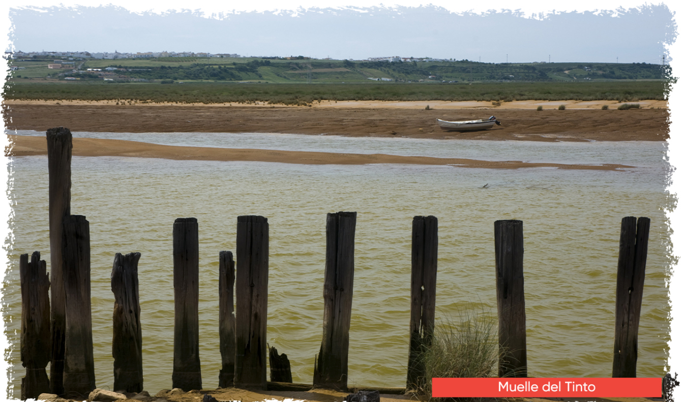
Muelle del Tinto