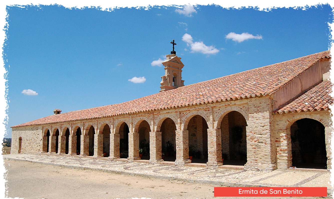
Ermita de San Benito