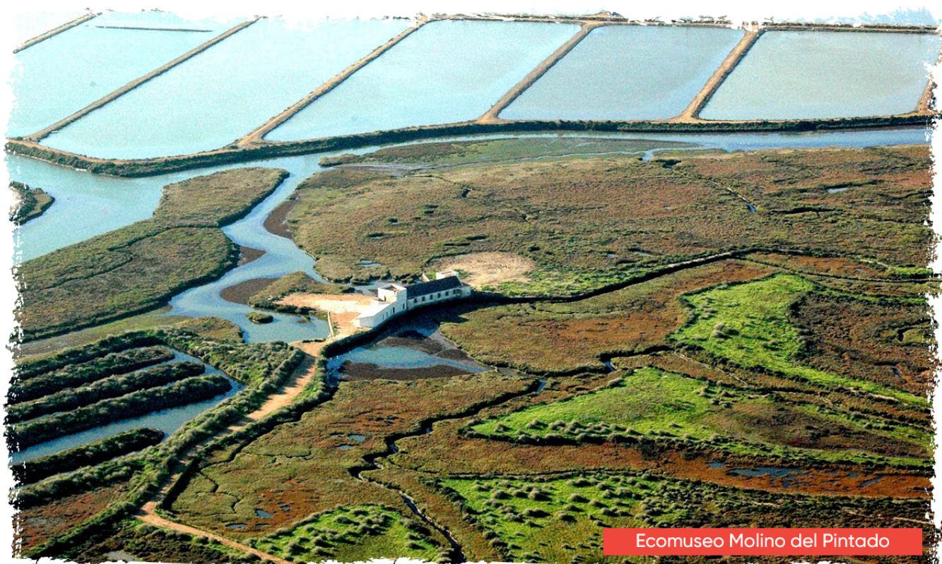
Ecomuseo Molino del Pintado