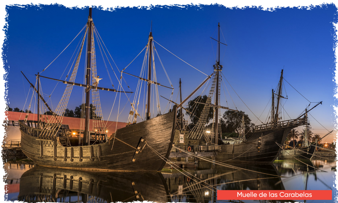
Muelle de las Carabelas